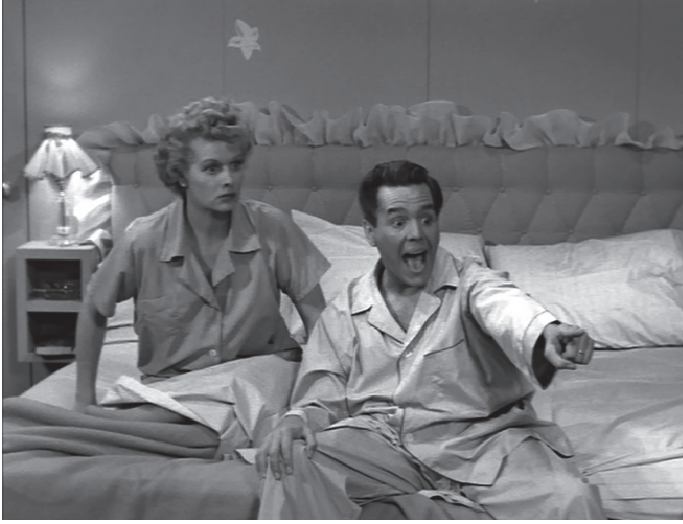
شكل ٥-٣: لوسي ريكاردو؛ ربة المنزل المضحكة في مسلسل «أحب لوسي»، مع زوجها ريكي ريكاردو (لعب دورَهما لوسيل بول وديزي أرنيز).

طاقم التمثيل نفسه (٢٠٠٨). (انظر شكل ٥-٤). اكتسب المسلسل التلفزيوني جمهورًا من بين أكثر الجماهير عددًا وتحمسًا له في تاريخ التلفزيون الحديث. وتتجلى شعبيته الهائلة والمستمرة في مرات إعادة بثّه، ومبيعاته على أقراص الفيديو الرقمية، وتناوله في المنتديات الإلكترونية (انظر ديمسي ٢٠٠٣، أبلسون ٢٠٠٦، إليوت ٢٠٠٨)، وهو جزء لا يتجزأ من ثقافة الطالب الجامعي؛ فالغالبية العظمى من طلابنا في فصول دراسة الإعلام على مدى السنوات العشر الماضية يعرفون هذا المسلسل، والعديد منهم من محبيه المتحمسين.