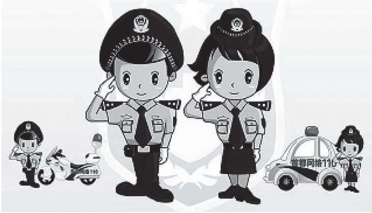
شكل ٢-١: الرسم الصيني الذي يُذكرك بأن أنشطتك على الإنترنت مراقبة.

وأخيرًا، ما الدور الذي يلعبه التعاون من جانب شركات الاتصالات مثل جوجل أو تايم وارنر أو أمريكا أون لاين أو سيسكو سيستمر في جهود الرقابة التي تبذلها الحكومة الصينية (شيلر ٢٠٠٧)؟ هل البرامج والأجهزة التي تسمح بتنفيذ الرقابة تستخدمها الحكومة الصينية فقط، أم أن حكومات أخرى تستخدمها، بما في ذلك الولايات المتحدة؟ 3