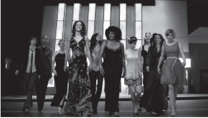
شكل ٥-١٠: النساء الساحرات من مسلسل «حياة المثليات»، من إنتاج شبكة شوتايم.

— الذي صاحَبته قُبلةٌ مثليَّةٌ على الهواء لتقديم شخصيةٍ إيلين الجديدة في هذه الحلقة — ضجةٌ كبيرةٌ في وسائل الإعلام، وأدَّى إلى توعية الجمهور بمسألة تمثيل المثليين. تمحور المزيد من أكثر المسلسلات حداثةً — مثل مسلسل «ويل وجريس» (١٩٩٨- ٢٠٠٦)، ومسلسل «مجتمع المثليين» (كوير آز فولك، ٢٠٠٠-٢٠٠٥)، ومسلسل «حياة المثليات» كما ذُكر سابقًا — حول شخصياتٍ وعائلاتٍ مثليَّةٍ، وبدأت عملية جعل هذه التمثيلات طبيعية. وكما ذُكر سابقًا، يوجد بحث ممتاز في مجال الدراسات الإعلامية (والترز ٢٠٠١) يوثق العلاقة بين التمثيلات السينمائية والتلفزيونية الواضحة للمثليين والمثليات ووقوع الجرائم ضدهم في الثقافة. وبينما تصبح هذه الصور أكثر عددًا، يمكننا أن نأمل فحسب أن تتضاءل هذه العلاقة (انظر شكل ٥-١٠).