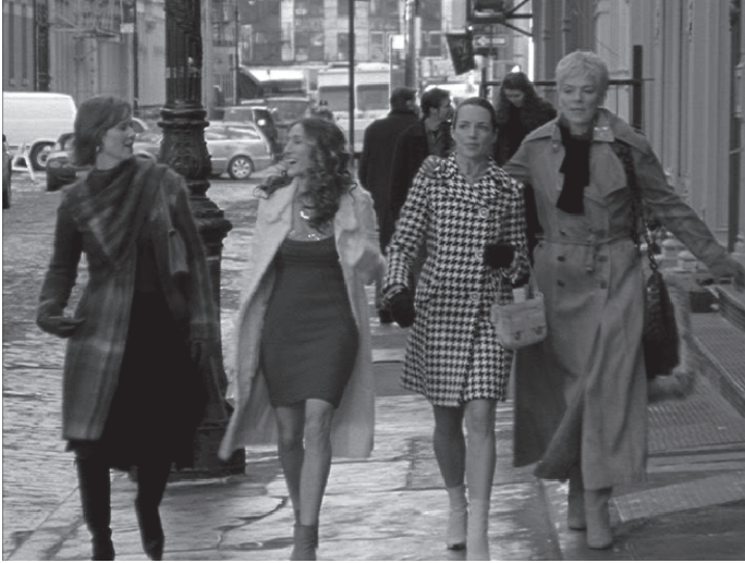
شكل ٥-٤: نساء مسلسل «الجنس والمدينة» الذي كان يُعرض على شبكة إتش بي أوه.

كاملة منه على أقراص الفيديو الرقمية عن طريق الشراء أو الاستئجار، ومواقع المعجبين الإلكترونية ومناقشاتهم حول المسلسل، سواءً على موقعه الرسمي أو على المواقع غير الرسمية، وتحول المسلسل إلى فيلم سينمائي ضخم مع احتمال إنتاج جزءٍ آخر أو أكثر له على مدى السنوات القليلة المقبلة. هذه كلها جوانب للبيئة الإعلامية الجديدة تؤثر على كيفية تلقي التلفزيون اليوم وتأثيره.