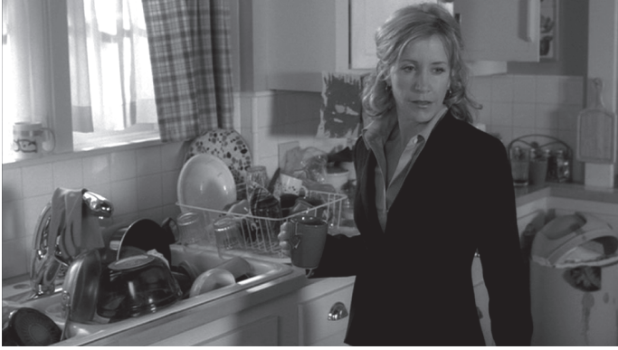
شكل ٥-٦: لينيت من مسلسل شبكة إيه بي سي «ربات بيوت يائسات».

باختصار، أوضحت الدراسات حول تأثير مشاهدة التلفزيون على البالغين في بعض الأحيان أن وسائل الإعلام لها آثار يصعب قياسها كميًا. ونحن لا نزال حاليًا في مرحلة تخيل وبدء دراسة تأثير السينما والتلفزيون ووسائل الإعلام الجديدة على هويات نوع الجنس لدى البالغين. وثمة حاجة إلى مزيدٍ من دراسات الجمهور والتأملات حول مسألة كيفية دراسة هذه الظواهر.