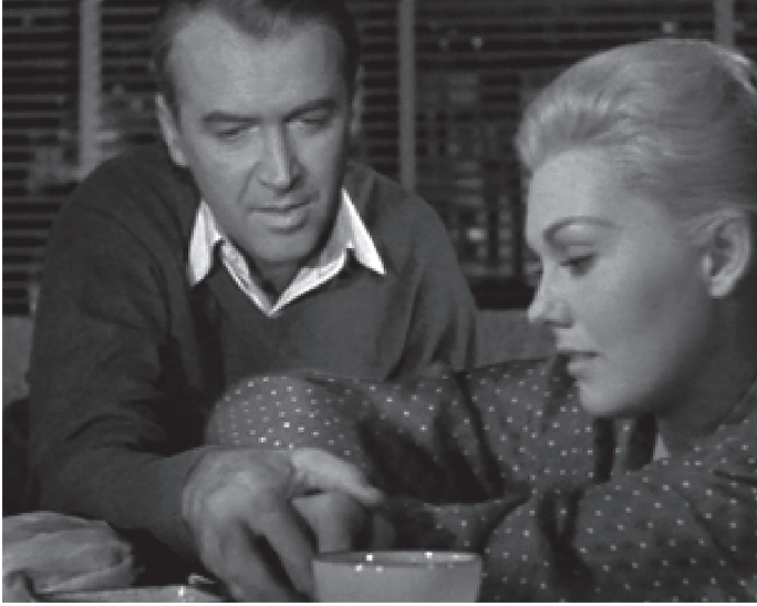
شكل ٥-٥: جيمي ستيوارت وكيم نوفاك في فيلم ألفريد هيتشكوك «دوار» (١٩٥٨).

بالتأكيد يُعدُّ نموذج مولفي مفيدياً في فهم قوة نص مسلسل «الجنس والمدينة»، سواءً في شكله التليفزيوني أو السينمائي؛ فشخصيات النساء في مسلسل «الجنس والمدينة» مصممة جزئياً بالطريقة «المثيرة» التي وصفتها مولفي. فكما هي الحال مع بطلات هيتشكوك التي ناقشتهن مولفي صراحةً، فقد أولى المسلسل اهتماماً هائلاً ومركزاً بكل تفاصيل الشعر والملابس، ومستحضرات التجميل، والمظهر العام للنساء الأربع البطلات. وتُشكّل هذه التفاصيل جزءاً كبيراً من مشاهد المسلسل وجاذبيته.