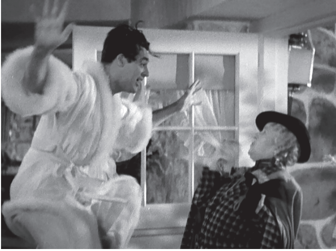
شكل ٥-٩: مشهد «لقد أصبحت فجأةً «سعيدًا/مثليّ الجنس»!« لكاري جرانت مرتديًا رداء حمام كاثرين هيبورن في فيلم «تنشئة بيبي» (١٩٣٨).

رعاة البقر في ستينيات القرن العشرين وسبعينياته. بين هذا الفيلم بوضوح تفاصيل التحيزات الاجتماعية ضد المثليين في ذلك الوقت، بينما يُقدّم في سياقٍ عامٍ قصة حبّ رقيقةً بين اثنين من الرجال المثليين.