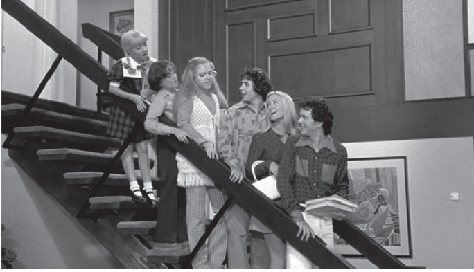
شكل ٥-٢: العائلة الأمريكية في مسلسل شبكة إيه بي سي «أسرة برادي الكبيرة».

التي تذاق في وقت الذروة، فعُرض العديد من المسلسلات التي تضم نساءً عزباوات في أدوار البطولة في وقت الذروة، منها مسلسل «تلك الفتاة» (ذات جيل)، الذي يدور حول امرأة شابة تحاول أن تصبح ممثلة (١٩٦٥-١٩٧١)، وقد بدأ عرضه عام ١٩٦٥، وبدأ عرض مسلسل «ماري تايلر مور» (ماري تايلر مور شو) عام ١٩٧٠، واستمر خلال هذا العقد (١٩٧٠-١٩٧٧)، ويصور بطلة عزباء ناضجة تسعى إلى العمل في مجال الصحافة.