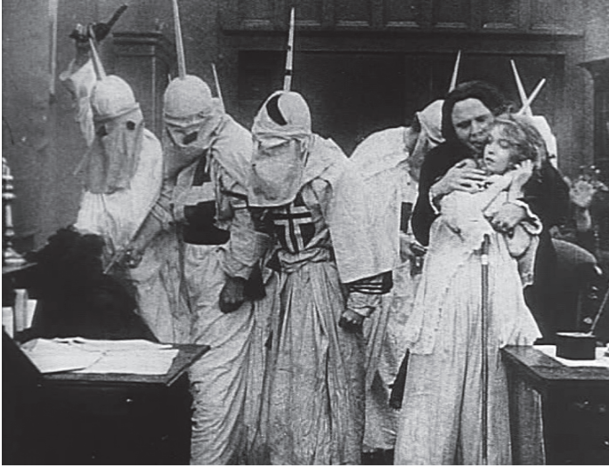
شكل ٧-٥: الكلان «ينقذون» الأثوثة البيضاء في فيلم دي دبليو جريفيث «ولادة أمة» (١٩١٥).

حكم دارسو الأفلام طوال عقود على هذه القصة بأنها تُقدّم وجهات نظرٍ عنصريةٍ للغاية؛ تؤمن دون شكّ بتفوّق البيض على الملونين. مع ذلك، لا جدال على أهميتها التاريخية في تطوّر الأفلام الروائية الأمريكية (روجين ١٩٩٢، ١٩٩٦، جاكسون ٢٠٠٨). 5 هذه الحقيقة وغيرها من سمات صناعة السينما في هوليوود دفعت الباحثين إلى وضع نظريات حول مركزية العنصرية في منظومة السينما الهوليوودية، سواءً أكانت العنصرية التي تُعلي من شأن البيض على الملونين (روجين ١٩٩٦)، أو معاداة السامية (جابلر ١٩٨٨، بروكين ١٩٩٨)، أو غيرها من أشكال العنصرية أيضاً (أونو ٢٠٠٨، تشونج تحت الطبع).